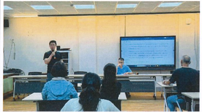
115年5月8日(星期五)中午 12:45