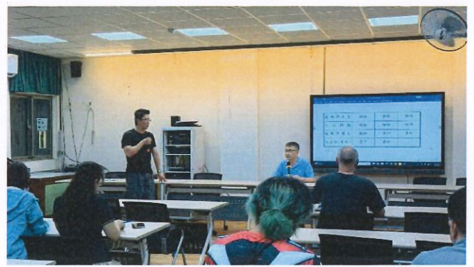
115年5月8日(星期五)中午 12:45