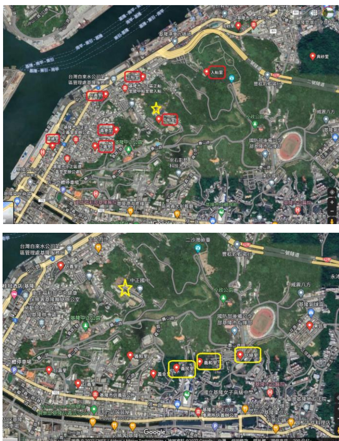
圖 1-1 本校學區內各里位置圖(不含和平島)。黃色星號為本校，紅色框里名為本校學區，色框里名代表只有部分鄰為本校學區。

基隆市立中正國民中學(以下簡稱本校)位於基隆市中正區中船路 36 巷 59 號，學區有信義區的信綠里(第 15、16、17、21 鄰)、義民里(第 9 鄰)、義和里(第 17 鄰)等里；以及中正區的信義里、義重里、正義里、港通里、德義里、中船里、入船里、正船里(圖 1-1)，及位於和平島的社寮里、和憲里、平察里(圖 1-2)等里。