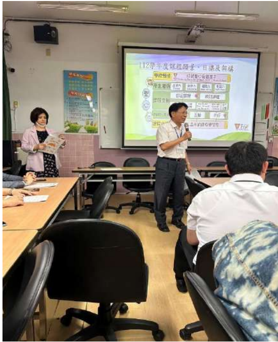
113.4.23 課程發展委員會-說明今日討論議題