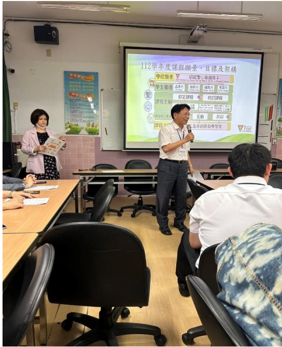
113. 4. 23 課程發展委員會-說明今日討論議題