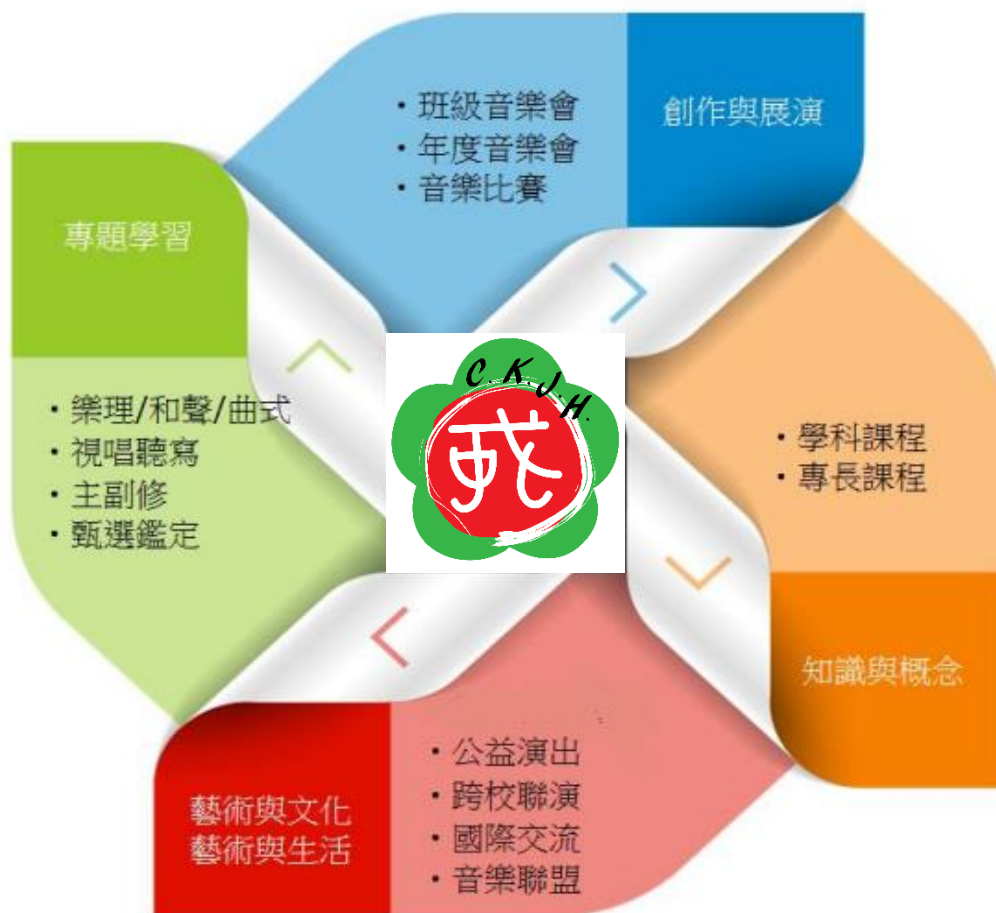
基隆市立成功國中藝術才能音樂班課程架構