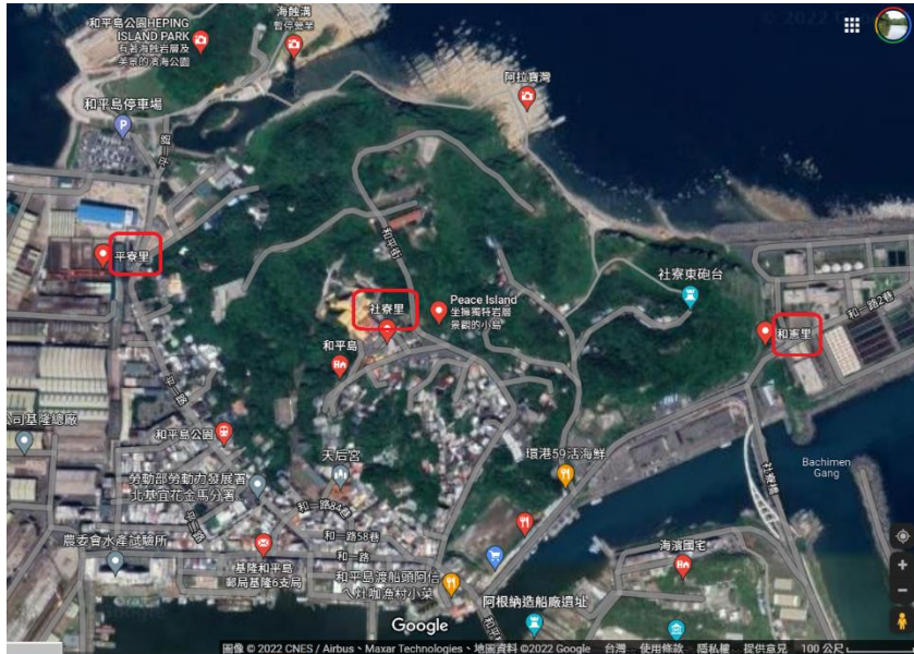
圖 1-2 本校和平島學區：平寮里、社寮里、和憲里。

由圖 1-1 可見，本校位於大片綠色森林之中，周圍乃是基隆最著名的風景：中正公園。此外尚有基隆主普壇、十八羅漢洞、役政公園、海門天險等，自然環境宜人，古蹟文化豐富。外地遊客經常到此遊覽，可惜交通不便，自民國 54 年以來，至今沒有規劃公車路線。