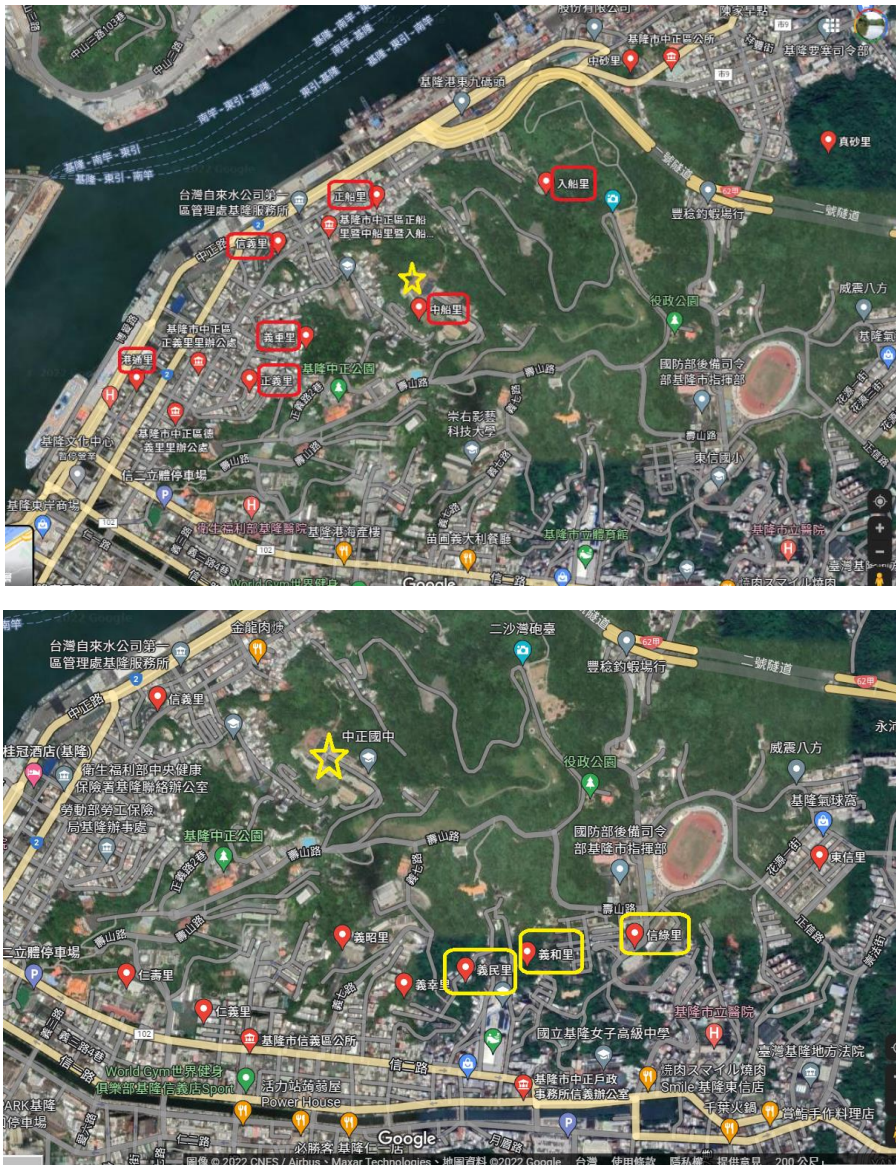
圖 1-1 本校學區內各里位置圖(不含和平島)。黃色星號為本校，紅色框里名為本校學區，色框里名代表只有部分鄰為本校學區。

基隆市立中正國民中學(以下簡稱本校)位於基隆市中正區中船路 36 巷 59 號，學區有信義區的信義里(第 15、16、17、21 鄰)、義民里(第 9 鄰)、義和里(第 17 鄰)等里；以及中正區的信義里、義重里、正義里、港通里、德義里、中船里、入船里、正船里(圖 1-1)，及位於和平島的社寮里、和憲里、平寮里(圖 1-2)等里。