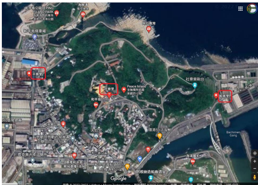
圖 1-2 本校和平島學區：平寮里、社寮里、和憲里。

由圖 1-1 可見，本校位於大片綠色森林之中，周圍乃是基隆最著名的風景：中正公園。此外尚有基隆主普壇、十八羅漢洞、役政公園、海門天險等，自然環境宜人，古蹟文化豐富。外地遊客經常到此遊覽，可惜交通不便，自民國 54 年以來，至今沒有規劃公車路線。